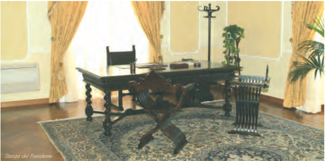
Stanza del Presidente