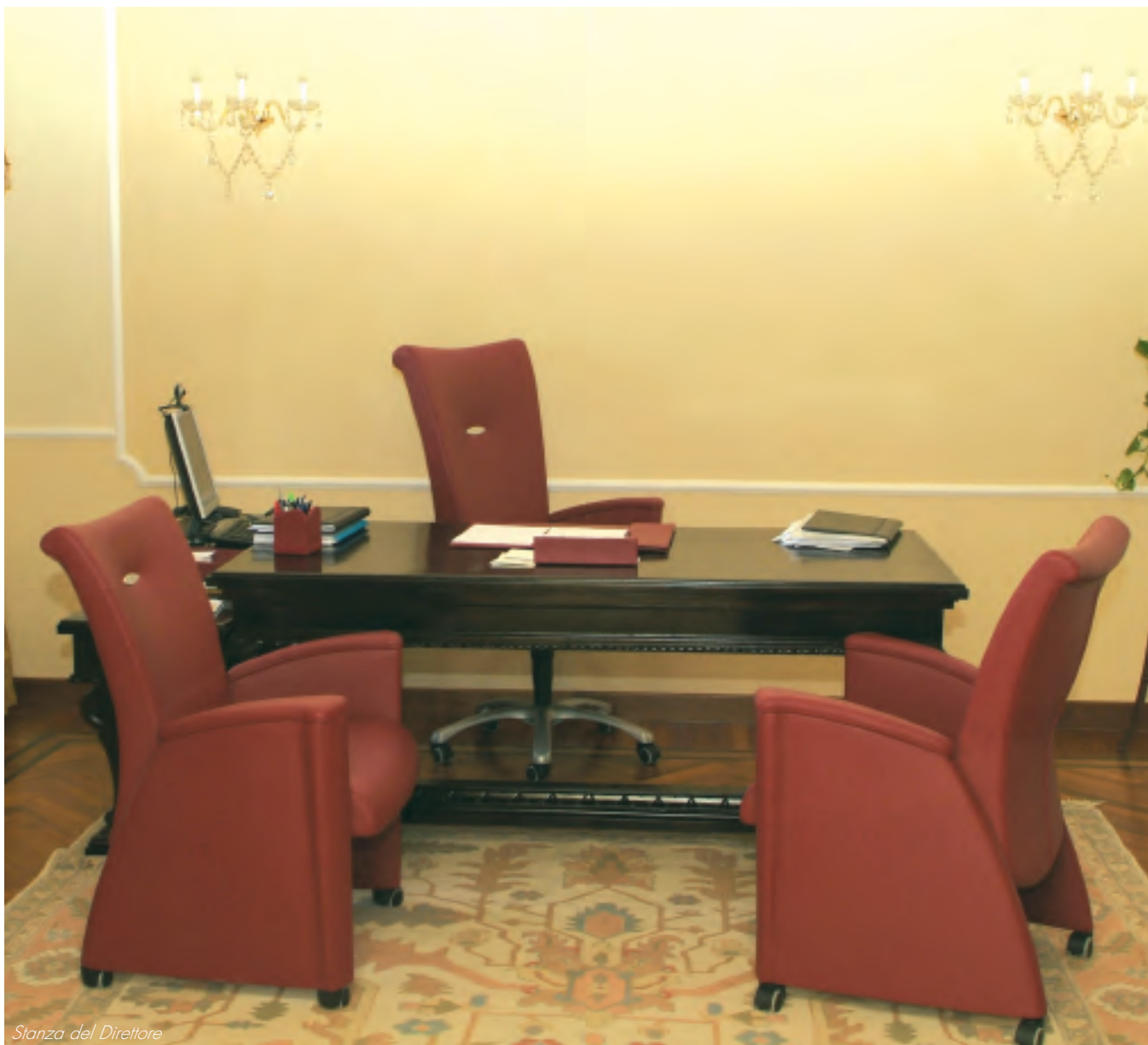
Stanza del Direttore

quet, parte dell'impianto elettrico e di condizionamento. Inoltre tutte le pareti e le opere lignee – prosegue - sono state aggredite in maniera massiccia dal fumo. Gli infissi esterni e soprattutto quelli interni sono stati completamente compromessi dal calore così come quasi tutti gli arredi e le apparecchiature tecnologiche presenti nella sede". Palazzo Salsano, l'immobile che ospita Confindustria Catanzaro, è un edificio pregevole, acquistato da