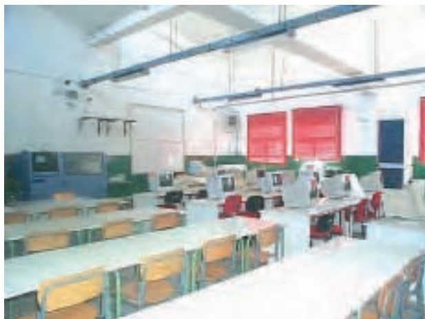
Aula informatica dove si è tenuto il corso

Questa è la dimostrazione di quanto sia importante non erogare semplicemente formazione ma erogare formazione di qualità.