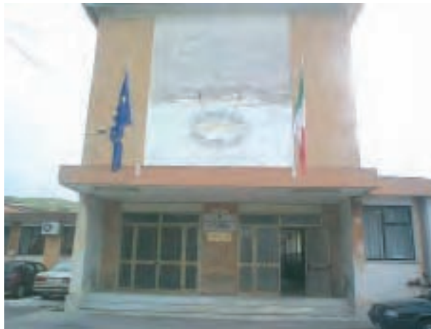
Ingresso Istituto Professionale di Stato per l'industria e l'artigianato "G. Ferraris" - di Catanzaro

Al termine delle operazioni procedurali di verifica effettuate dal MIUR, nel mese di Aprile 2006, si è concluso ufficialmente il percorso formativo IFTS (istruzione e formazione tecnica superiore) OP.LA (Opportunità Lavoro) di Italia Lavoro, progettato e realizzato da un partenariato che ha avuto l'Ipsia - Istituto Professionale di Stato per l'industria e l'artigianato "G. Ferraris" - di Catanzaro come capofila e, tra gli altri partner, Confindustria Catanzaro.